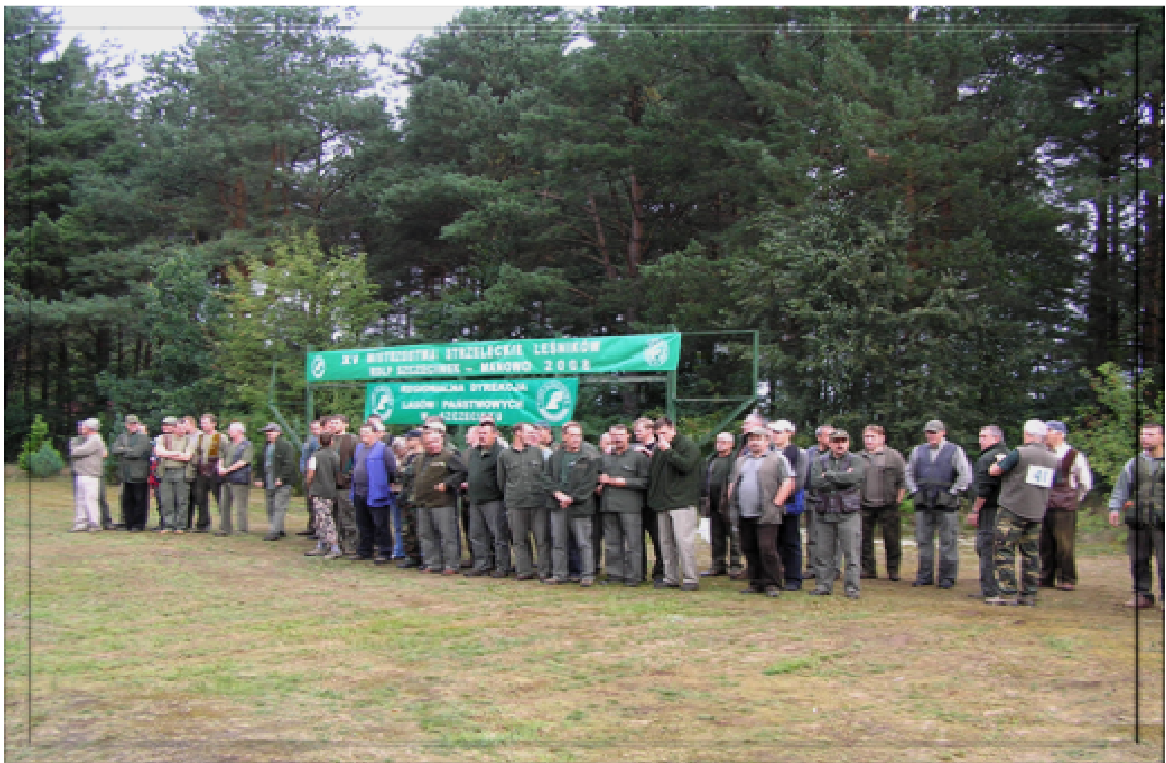
Grupa leśników uczestniczących w zawodach strzeleckich w Manowie