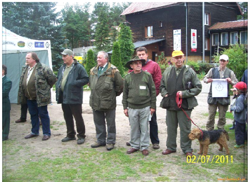
Autor zdjęć: Janusz Tobijasz