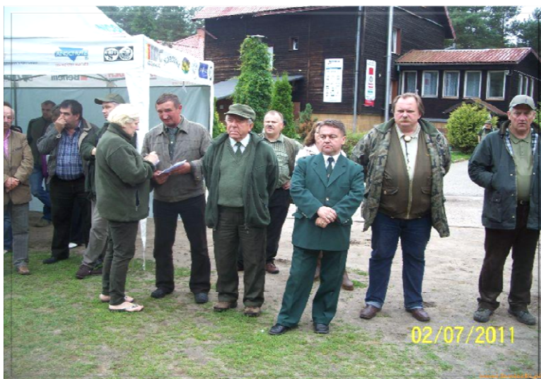
Ekipa sędziów strzeleckich na zbiórce podczas rozpoczęcia zawodów strzeleckich