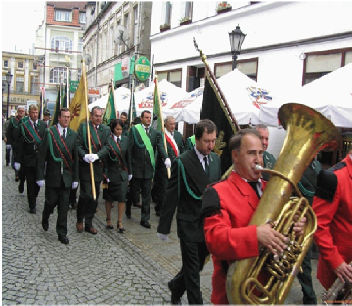
Przemarsz uczestników spotkań myśliwskich ulicami Połczyna Zdroju