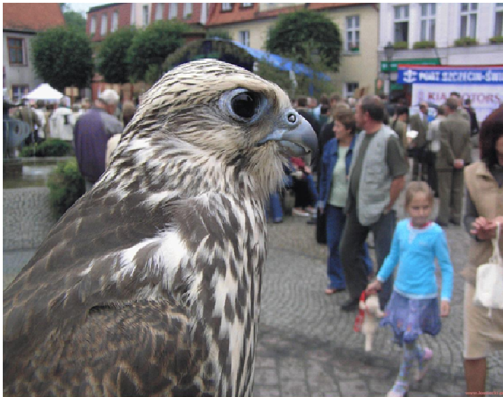
Sokół wędrowny w całej okazałości