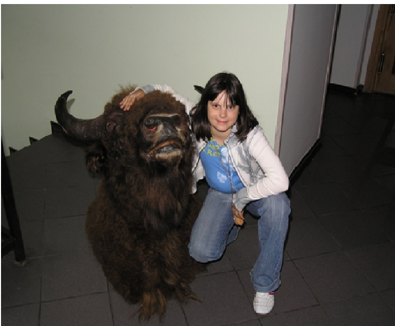
Medalion żubra – dar leśników i myśliwych dla Urzędu Miasta i Gminy Połczyn Zdrój