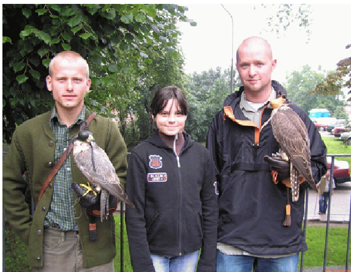
Grupa sokolników ze Szkoły Leśnej w Warcinie