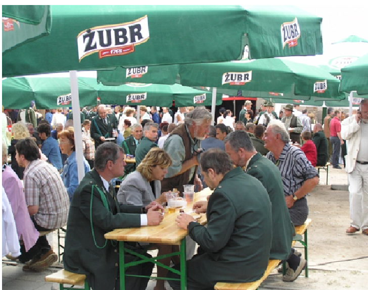
Imprezy towarzyszące spotkaniom myśliwskim